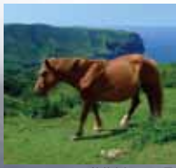
放牧されている馬